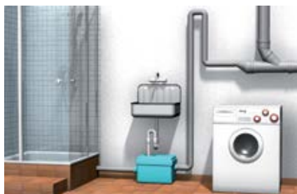
Водопроводные трубы с давлением до 1,5 бар