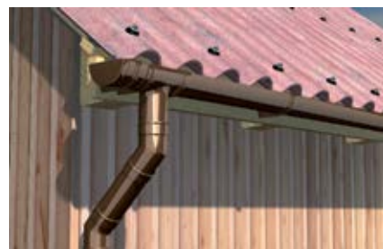
Водосточные трубы из ПВХ