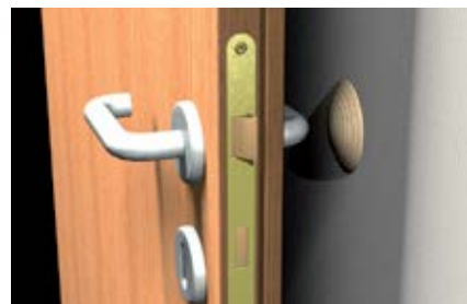
Ограничители хода дверей