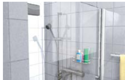
Склеивание и герметизация алюминиевых профилей